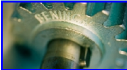
Kostengünstig und robust ausgeführte mechanische Details.