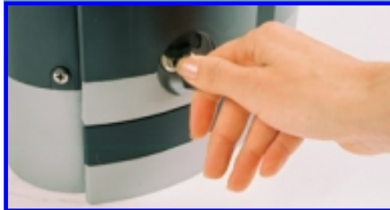
Einfach abschließbare Entriegelung