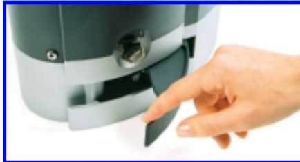
Leichtgängige, abschließbarer, Aluminium Entriegelungshebel.